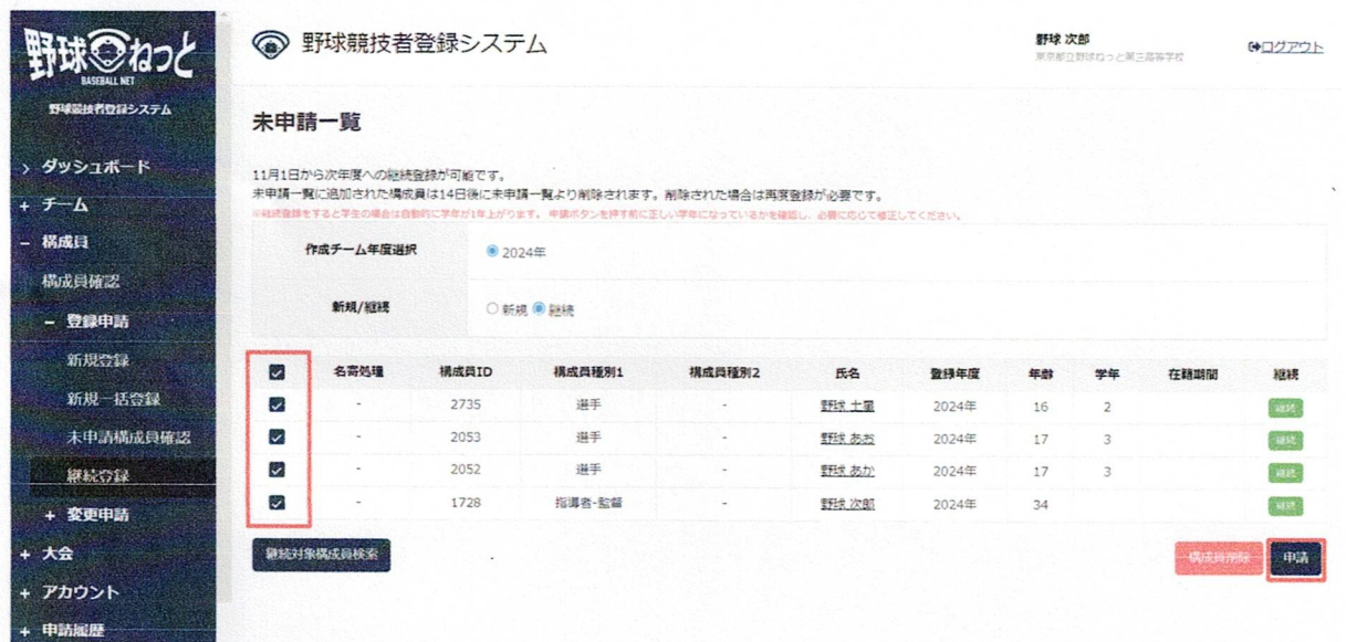
継続対象構成員一覧画面